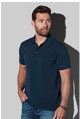
ST9060 Lux Polo